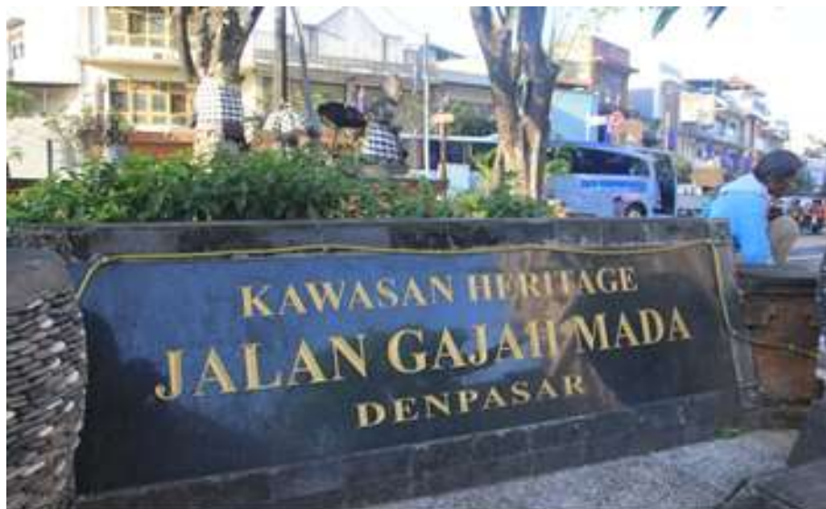
Gambar 2. Prasasti Kawasan Heritage Gajah Mada

Jalan Gajah Mada awalnya difungsikan sebagai jalan provinsi setelah pengembangan Kota Denpasar, kawasan ini berubah menjadi jalan kota. Jalan Gajah Mada menjadi akses utama masuk ke Kota Denpasar menjadikan kawasan ini memiliki peran penting. Sebagai kawasan pusat perdagangan dan kawasan heritage Jalan Gajah Mada memiliki ciri khas utama berupa bangunan-bangunan tua berarsitektur tradisional khas Bali. Deretan bangunan tua tersebut berfungsi sebagai toko, fakta bahwa semenjak masa kerajaan sampai pemerintahan kolonial Belanda kawasan ini memiliki peran penting yakni memasok kebutuhan pokok warga kota Denpasar dan sekitarnya.