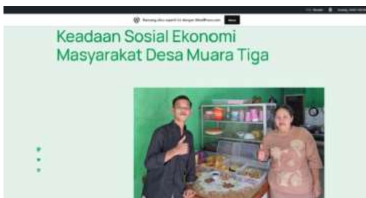
Gambar 4. Hasil wordpress blogger peserta pengabdian

Berdasarkan keseluruhan hasil tersebut dapat disimpulkan bahwa kegiatan pengabdian masyarakat ini berhasil meningkatkan kompetensi literasi digital peserta secara signifikan. Materi pelatihan yang disampaikan dinilai relevan, aplikatif, dan mudah dipahami oleh peserta, terutama generasi muda. Dengan peningkatan pemahaman pada berbagai aspek digital tersebut, peserta memiliki kemampuan yang lebih baik dalam memanfaatkan teknologi secara aman, bijak, dan bertanggung jawab. Penyelenggaraan kegiatan pengabdian kepada masyarakat ini dilaksanakan oleh dosen Fakultas Ekonomi Universitas Sriwijaya. Keberhasilan pelaksanaan pengabdian tidak hanya diukur dari hasil evaluasi terhadap pemahaman peserta terhadap materi yang diberikan, tetapi juga melalui penilaian peserta terhadap kinerja penyelenggara dan pemateri selama kegiatan berlangsung. Berdasarkan hasil evaluasi yang dikumpulkan dari para peserta, secara umum kegiatan pengabdian mendapatkan tanggapan yang sangat positif. Evaluasi dilakukan terhadap beberapa aspek utama, yaitu kesesuaian materi, tingkat pemahaman peserta, penyampaian oleh pemateri, waktu pelaksanaan, serta keseluruhan pelatihan. Berikut terlampir hasil wordpress blogger peserta pengabdian pada Gambar 4.