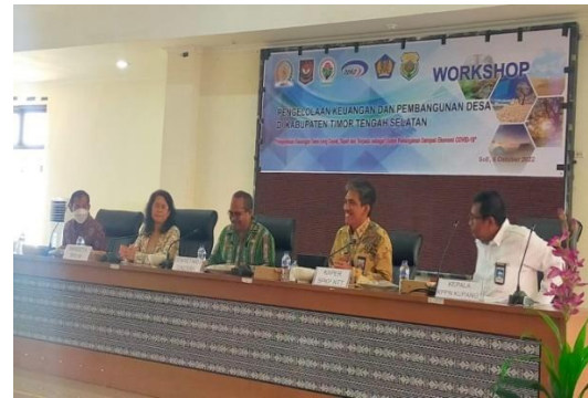
Foto 3. Narasumber PkM