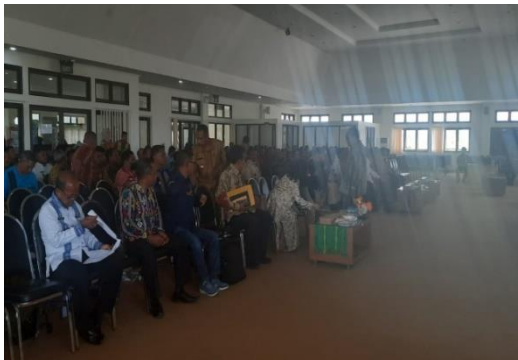
Foto 2. Peserta PkM