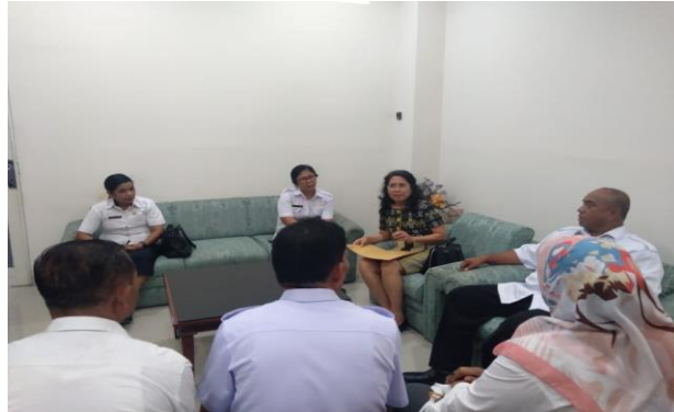
Foto 1. Diskusi untuk melaksanakan kegiatan PkM