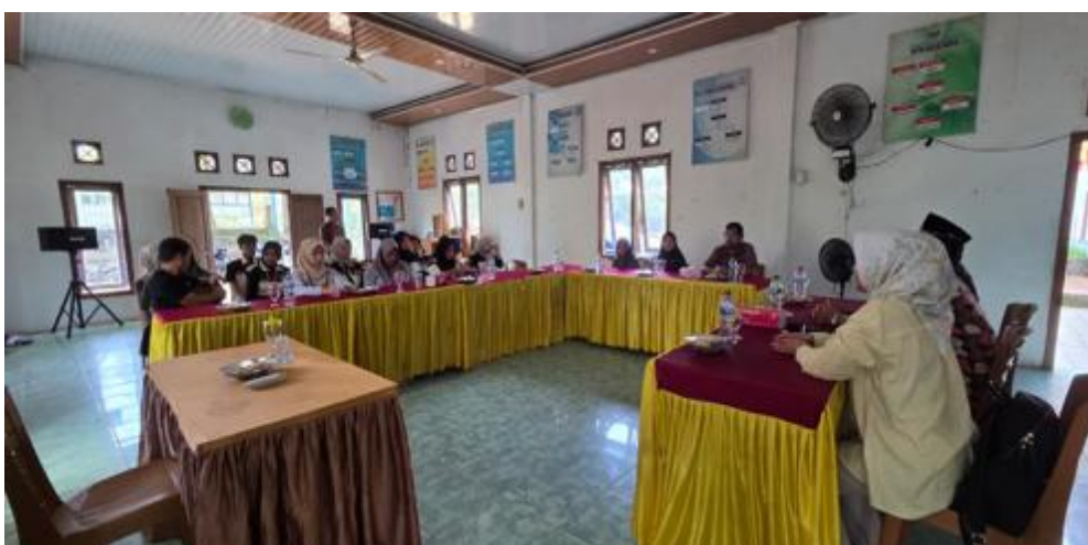
Gambar 3. Sosialisasi penyusunan laporan keuangan dan pengelolaan keuangan

Dapat dilihat pada Gambar 2 dan 3 kegiatan FGD dan sosialisasi berjalan dengan lancar dan peserta telah memahami dan akan mempersiapkan hal-hal yang dibutuhkan dan diperhatikan saat pelatihan dilaksanakan. Dalam pelaksanaan diskusi, peserta juga menyampaikan bahwa mengalami kendala dalam menghitung harga pokok produksi produk yang diproduksi dan juga tentunya mengakibatkan peserta kesulitan dalam menentukan harga jual. Peserta berharap juga mendapatkan materi dan