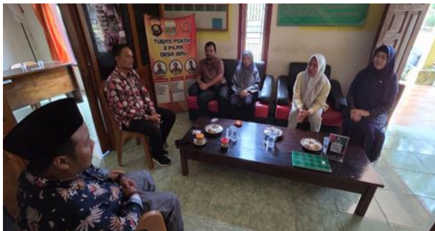
Gambar 1. Kunjungan dan Survei Lokasi Pengabdian

Tahap pertama dalam kegiatan PKM ini adalah mengunjungi lokasi pengabdian untuk silaturahmi kepada pemerintah Desa Ibru dan survei lokasi pengabdian. Tim pengabdian disambut baik dan hangat oleh Kepala Desa Ibru dan Direktur BUMDes Suka Makmur. Tim pengabdian memperkenalkan diri dan menyampaikan maksud untuk rencana pelaksanaan PKM di Desa Ibru dan berdiskusi tentang kapan waktu yang tepat dilaksanakan sosialisasi dan pelatihan, dapat dilihat pada Gambar 1.