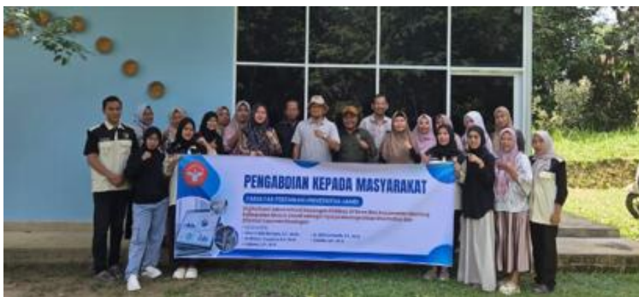
Gambar 4. Pengabdian kepada masyarakat di Desa Ibru

Tim PKM memperkenalkan aplikasi pembukuan berdasarkan Keputusan Menteri Desa, Pembangunan Daerah Tertinggal, dan Transmigrasi Republik Indonesia kepada peserta pelatihan. Aplikasi ini dirancang oleh Kementerian Desa agar penyusunan laporan oleh BUMDes dapat dilakukan secara efektif dan efisien. Peserta mengalami kendala dalam menggunakan aplikasi pembukuan tersebut dan juga kendala dalam pemahaman proses pembukuan dari penjurnalan sampai dengan laporan keuangan. Haeruddin, Ibrahim, and Aigistina (2023) menekankan pentingnya pelatihan literasi digital bagi pengurus BUMDes agar mampu mengoperasikan sistem keuangan berbasis aplikasi secara mandiri dan berkelanjutan. Dalam kegiatan ini diberikan pengenalan terhadap fitur-fitur yang ada pada aplikasi pembukuan BUMDes.