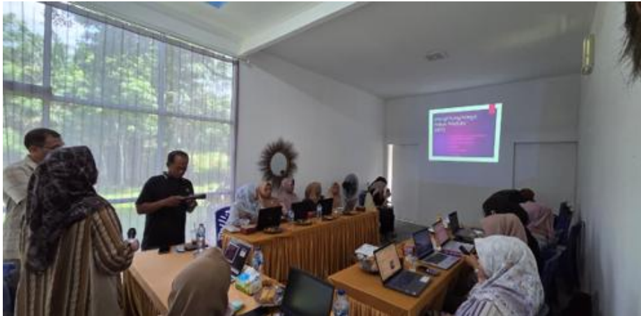
Gambar 5. Pelatihan menghitung harga pokok produksi