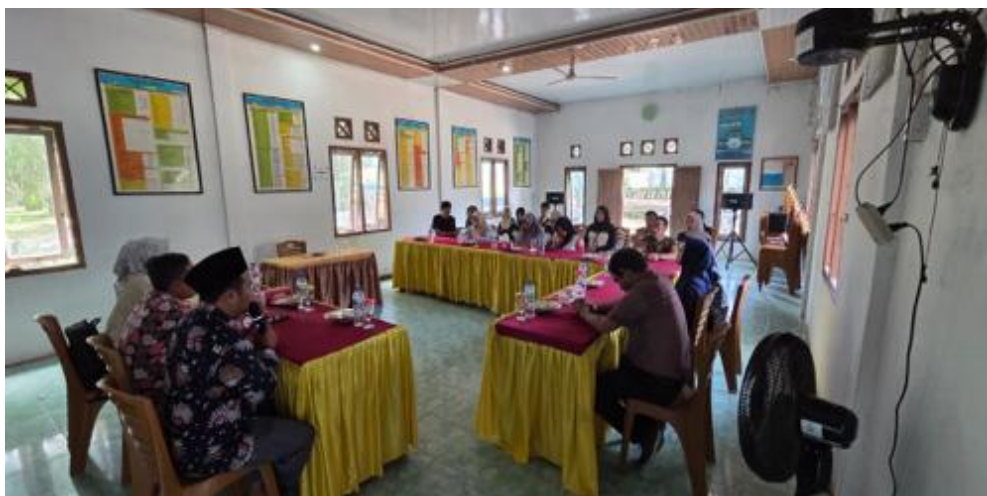
Gambar 2. Diskusi peserta, tim pengabdian, dan pemerintah desa

Setelah melakukan kunjungan dan survei kegiatan selanjutnya tim pengabdian memberikan sosialisasi kepada peserta yang terdiri dari pengelola BUMDes dan juga UMKM yang ada di Desa Ibru. Sosialisasi yang diberikan berupa pengenalan laporan keuangan dan alur penyusunan laporan keuangan serta aplikasi pembukuan yang akan digunakan oleh BUMDes yaitu aplikasi pembukuan berdasarkan BPK (2022) yang mengatur tentang akun dan bentuk laporan keuangan BUMDes. Teknis dalam pelaksanaan pelatihan juga disampaikan pada kegiatan sosialisasi ini sehingga peserta pelatihan dapat memahami hal-hal yang perlu disiapkan dalam pelaksanaan kegiatan pelatihan dan dapat memahami materi pelatihan serta mempraktikkan langsung pembukuan secara digital menggunakan aplikasi sehingga penyusunan laporan keuangan dapat dilakukan secara efisien dan efektif. Yuliana, Siahaan, and Kontesta (2023) menjelaskan bahwa pemberdayaan masyarakat melalui BUMDes berbasis teknologi digital dapat meningkatkan partisipasi dan kemandirian ekonomi desa. Dalam kegiatan sosialisasi ini juga dilakukan diskusi grup antara tim pengabdian, peserta, dan pemerintah desa. Diskusi yang dilakukan adalah penyampaian masalah dan kendala yang dihadapi peserta dalam penyusunan laporan keuangan dan pengelolaan keuangan kepada tim pengabdian dan pemerintah desa ( Suargita, Skristyanto, & Wirata, 2026 ).