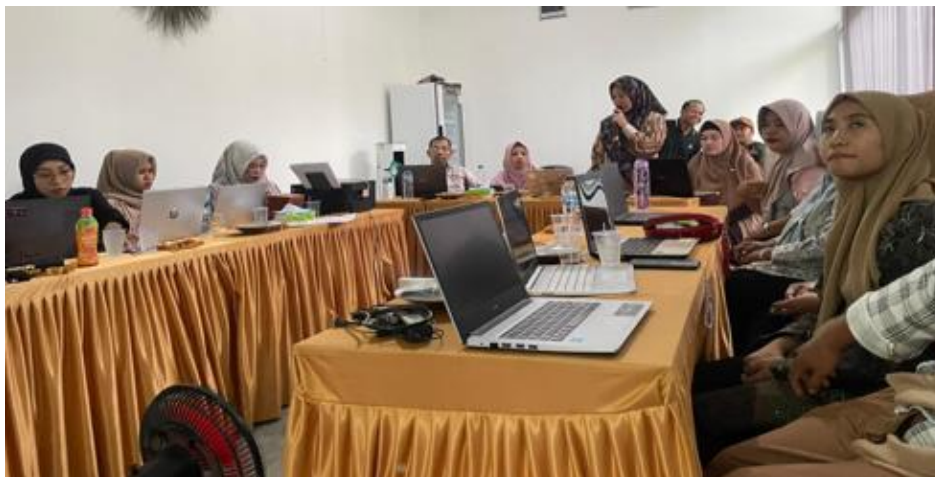
Gambar 6. Praktik menyusun laporan keuangan dengan aplikasi

Kegiatan selanjutnya adalah praktik menyusun laporan keuangan dari penjurnalan. Praktik langsung dengan transaksi yang sudah dilakukan oleh BUMDes dan dicatat pada jurnal umum. Dalam sesi ini juga dilakukan diskusi antara peserta dan tim PKM. Peserta bertanya tentang jurnal transaksi yang sudah dilakukan apakah sudah benar atau belum, kemudian peserta bertanya tentang hal-hal yang belum dipahami dalam penggunaan aplikasi pembukuan dan makna dari laporan keuangan yang dihasilkan. Tampak antusias yang luar biasa dari peserta karena peserta dapat bertanya tentang hal-hal yang kurang dipahami dalam melakukan pembukuan laporan keuangan BUMDes padahal laporan keuangan sangat penting bagi BUMDes. Masing-masing peserta langsung praktik menyusun laporan keuangan pada laptop dan tim PKM melakukan pendampingan dan memberikan koreksi jika terjadi kesalahan jurnal dan hal lainnya. Asmawanti, Fitranita, and Febriani (2022) menemukan bahwa kinerja BUMDes sangat dipengaruhi oleh pengelolaan keuangan yang sesuai dengan standar akuntansi dan sistem pelaporan yang terstruktur.